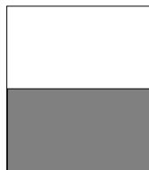
1/2 page 14 x 10 cm

Remise quantitative : de 2 à 3 éditions (- 20%), de 4 à 7 (- 25%), + de 8 (- 40%)